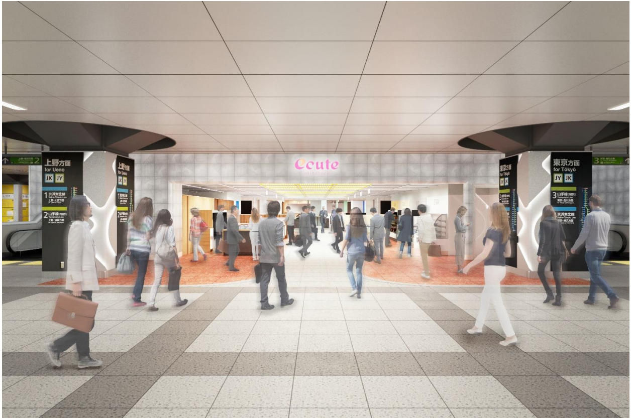
画像はイメージです

※1 『Beyond Stations構想』については、下記をご参照ください。 https://www.jreast.co.jp/press/2020/20210303_ho04.pdf